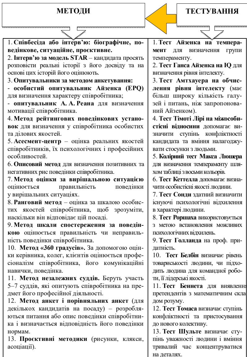
Рис. Сучасні підходи до оцінки компетенцій, які використовуються у сфері HR-менеджменту