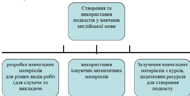
Рис. Використання подкастингу для вивчення іноземної мови

текстів, зразки вимови, аудіо- та відеовправи, інтерактивні вправи. Подкасти – це неформальне цифрове джерело для опанування автентичних мовних та мовленнєвих матеріалів. Згідно з F. Rosell-Aguilar (2007) подкасти мають пропонувати вільний доступ до навчальної інформації про культуру, історію та мовні (лексика і граматична структура) й мовленнєві явища іноземної мови [27]. Ці матеріали є джерелом інформації про використання мови й допомагають слухачам у вивченні іноземних мов. З огляду на це дуже важливо транслювати ці подкасти на різних популярних платформах для ширшого охоплення аудиторії. На рисунку показано використання подкастингу для вивчення іноземної мови.