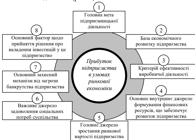
Рис. 1. Характеристика ролі прибутку підприємства в умовах ринкової економіки (за даними [1; 2])

За конкурентних ринкових відносин підприємство повинно отримати такий обсяг прибутку, який дав би йому змогу утримати свої позиції на ринку і забезпечити динамічний розвиток. Розглянемо роль прибутку підприємства в умовах ринкової економіки більш детально (рис. 1).